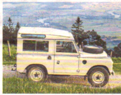
Ein Landrover Serie III aus dem Jahr 1984.