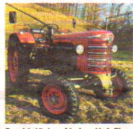
Prachtstück auf jedem Hof: Ein Hürlimann D90 Super-Spezial.