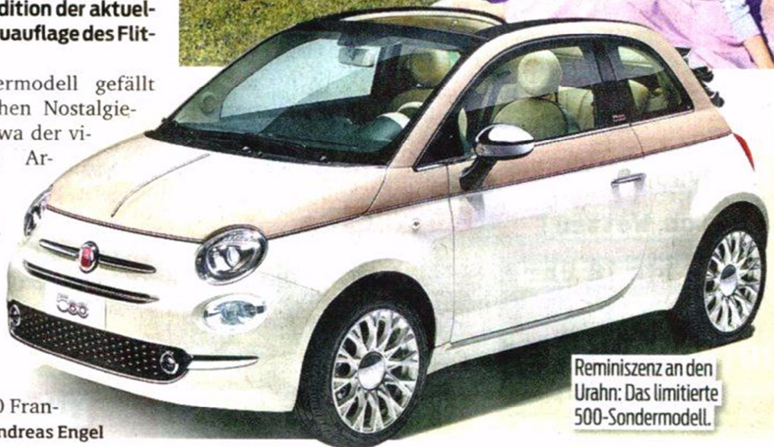
Reminiszenz an den Urahn: Das limitierte 500-Sondermodell.