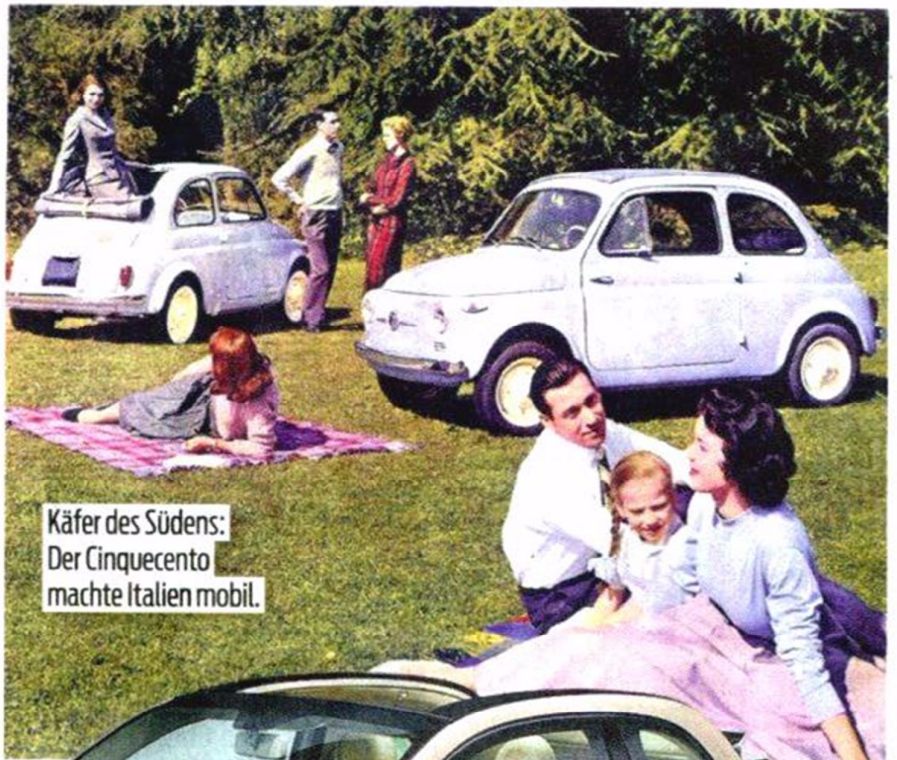
Käfer des Südens: Der Cinquecento machte Italien mobil.

Das Sondermodell gefällt mit so hübschen Nostalgie-Details wie etwa der vinylbezogenen Armaturentafel, Markenlogos im Klassikdesign und hübscher Zweifarblackierung. Er kostet als Cabrio mit Stoffverdeck ab 25 300 Franken. | Andreas Engel