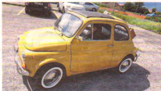
Passt in die Badewanne: Der Fiat 500 «Bambino».