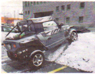
Gabriels Quadix nimmt alle Hindernisse.