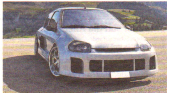
Geht ab wie ein Zäpfchen: Ollis Renault Clio 3.0 V6.