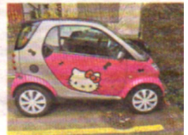
Hello Smart! Hello Kitty!