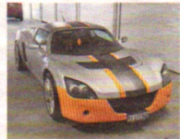
Jahrgang 2002: Ein aufgetunter Opel Speedster JG.