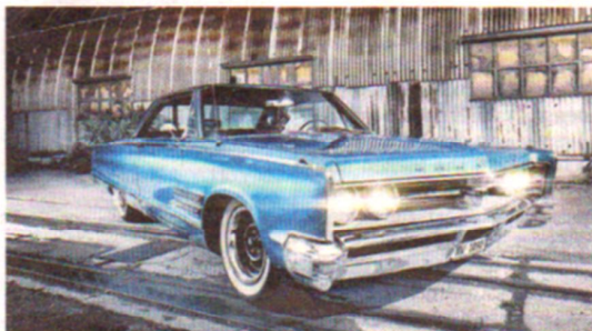
Ami-Fass: Peters Chrysler 300 von 1966.