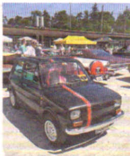
Noch ein Fiat: Diesmal der 126er.