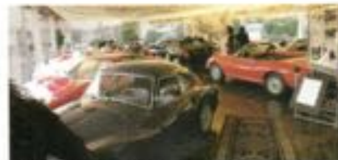
Rechts hinter Glas: Vorn wartet der Fiat 124, genannt Otto Yu, auf lockere Straßen; im Hintergrund ein roter Lancia Delta integrale