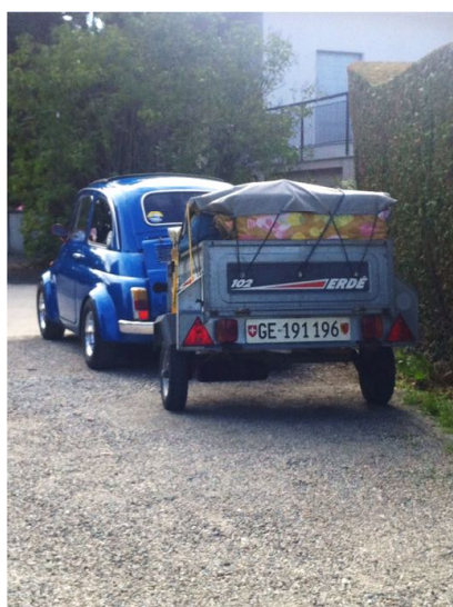
Au départ de la maison