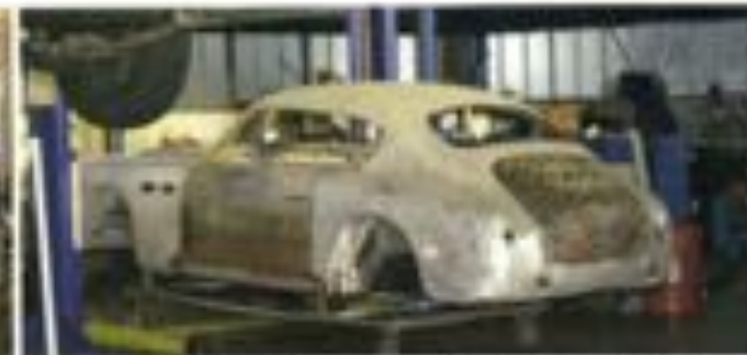
„Neuwagen“, sagt Koch, „kommen immer weniger in die Werkstatt.“ Da bleibt Zeit für die Restaurierung eines Lancia Delta von 1982