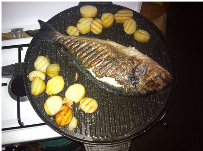
De la daurade

En 2 semaines, je rencontre deux propriétaires de 500 qui viennent m'accoster, dont un, qui me dit qu'il en a aussi une, mais avec un moteur 650, amélioré. Lui permettant de donner un coup d'accélérateur sur la mienne, il en ressort, incrédule, en disant : " un altro mondo"... Dans le parking du camping, visible depuis notre tente, la 500 est la coqueluche du camping, attirant regard, sympathie et admiration.