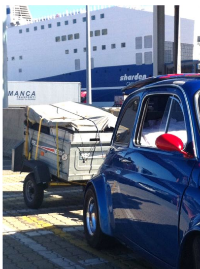
Ça va tanguer...

Après avoir immortalisé le départ de la maison, en milieu de matinée, départ pour les vacances. Passage à travers Genève, puis autoroute blanche, tunnel du Mont-Blanc, et autoroute italienne direction Genova. On ne va pas aussi vite avec la remorque que sans rien (c'est d'ailleurs interdit en Italie, mais pas en France...) et