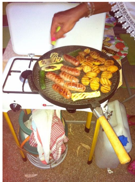
Pour des saucisses sardes