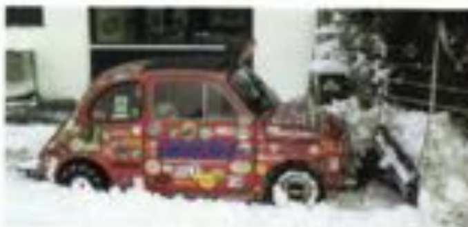
Was macht ein Fiat-Händler, wenn es schneit? Er hängt vorn an den 500er ein Räumschild und stellt die Antriebsachsen auf Traktorengurte