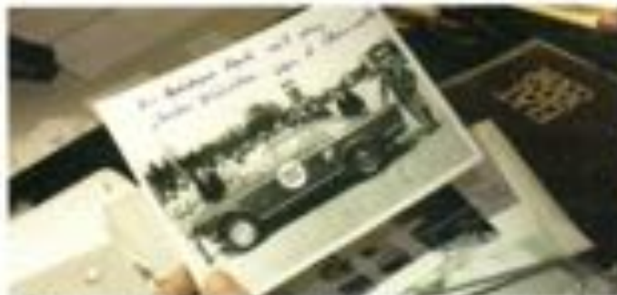
Das Fiat Abarth 2300 S Coupé wurde 1962 auf die Firma Carlis Abarth zugelassen. Später gehörte es Fiat, jetzt ist es in Kirchhausen heimisch