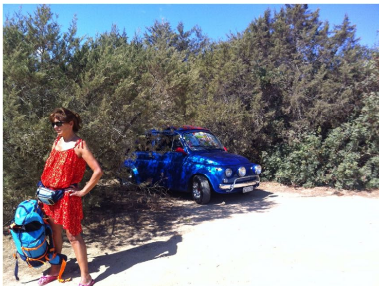
Une petite virée à Olbia