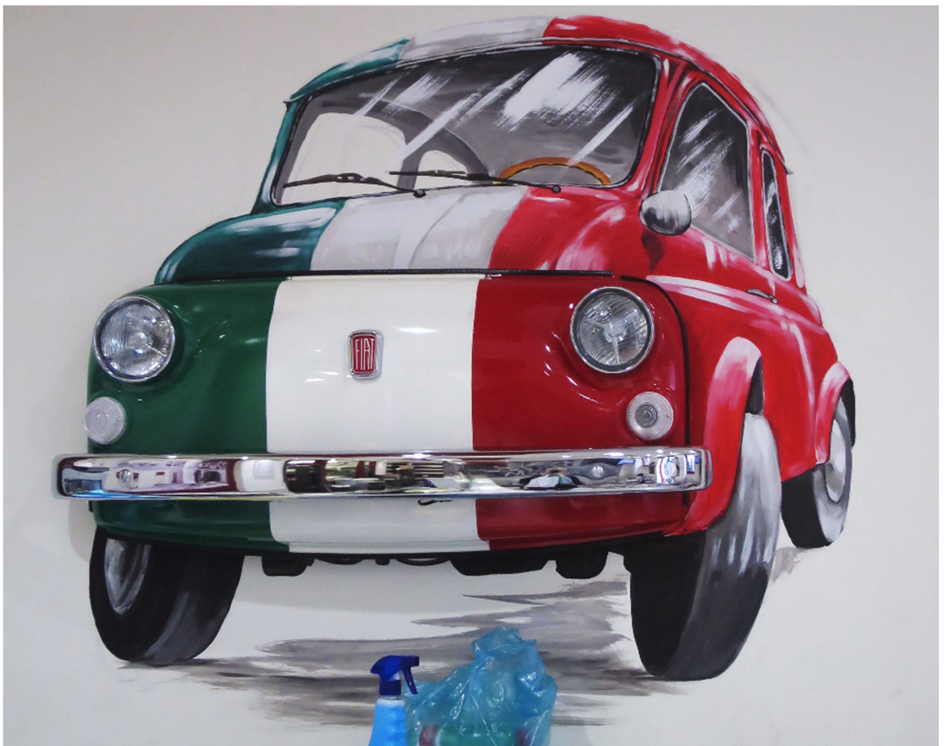
Bar Via Tiburtina in Rom: Fiat Front mit Wandmalerei