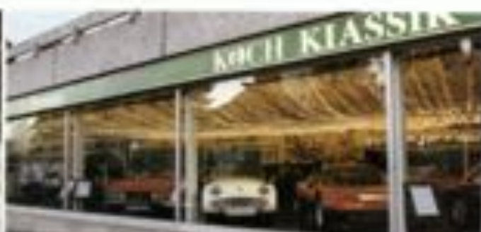
In der Ausstellungshalle von Koch Klassik gehen sich Oldtimer vom Triumph TR3A bis zum Ferrari Dino ein edles Duelltschen